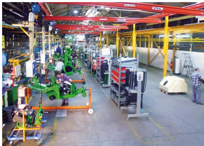
Сборочная линия Profihopper в Форбахе

В ближайшее время планируется также переоборудование сборочной линии газонокосилки Grasshopper для значительного повышения эффективности изготовления.